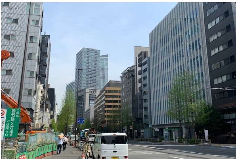
虎ノ門 ACT ビル正面の大規模再開発